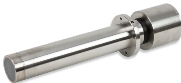
Figure 3 : Hydro-Probe SE

Un des avantages les plus nets de l'utilisation de sondes avec une variable étalonnée en usine est qu'en cas de remplacement ou de retrait temporaire de la sonde pour maintenance, un appareil de rechange peut être installé et les données d'étalonnage de la sonde précédente peuvent être chargées dans le nouvel appareil.